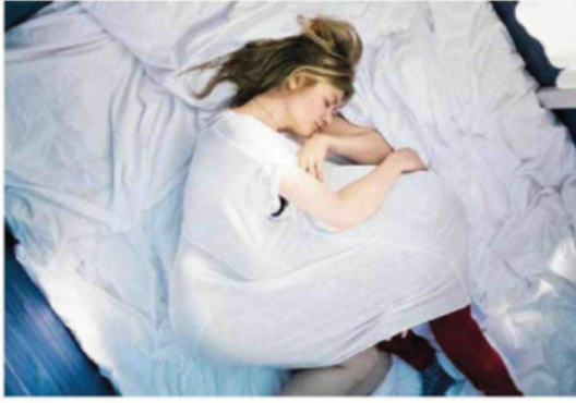
Berührend und bedrückend: „24 Wochen“ schaut hin, wo viele gerne wegschauen würden