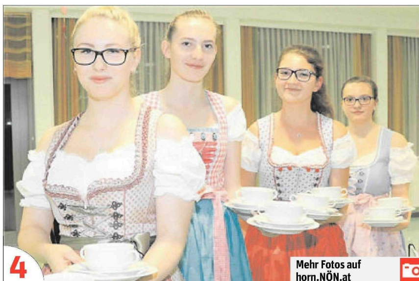
Mehr Fotos auf horn.NÖN.at