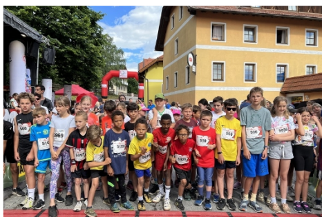
Der Herzlauf Kärnten in Baldramsdorf geht am 22. Juni in Szene.

Gemeinsam, mit der großartigen Unterstützung aus der Bevölkerung, vieler Vereine, Unternehmen und der Gemeinde, konnte der gesamte Reinerlös, in der Höhe von 28.803,- Euro, dem Verein „Herzkinder Österreich“, als Spende übergeben werden. Alles zum Wohl herzkranker Kinder.